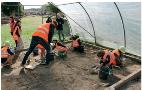
«Découverte de la fouille archéologique pour les petits»