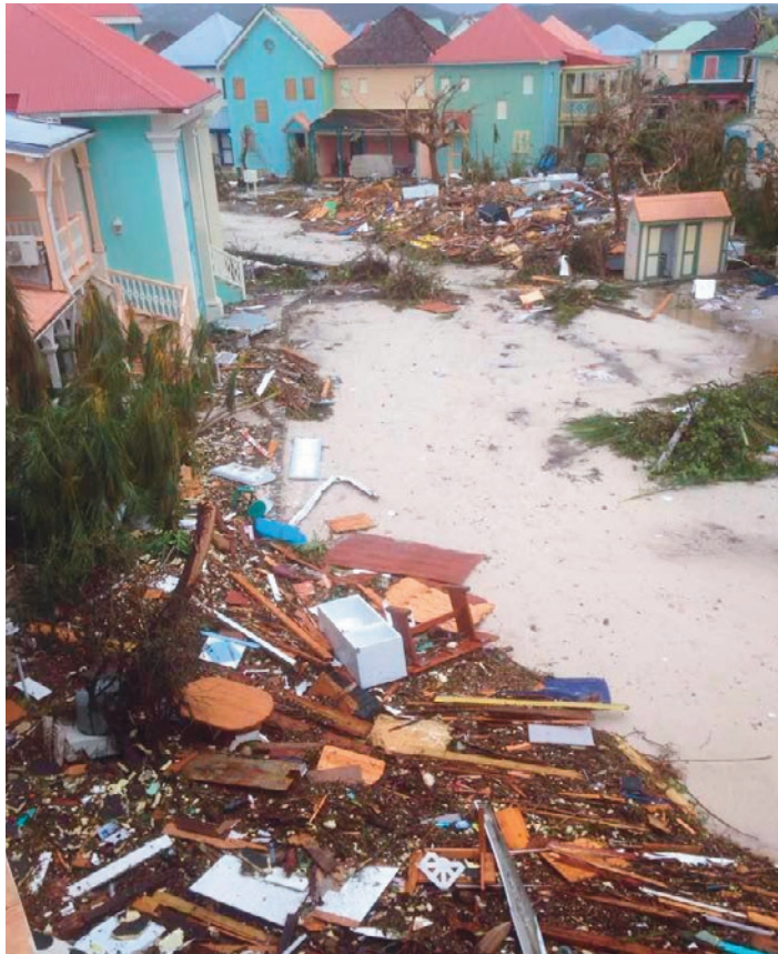
L'île de Saint-Martin a été détruite à 95 %. Sur place, des habitants ont tout perdu.

Daphnée est informée de la situation au jour le jour car cette île et ses habitants, elle