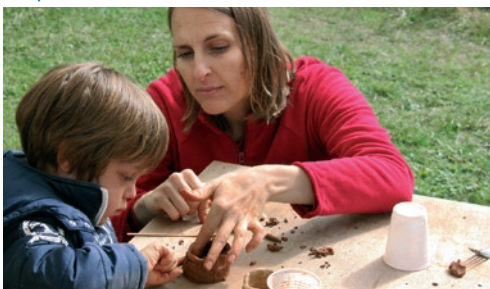
«Atelier de poterie»