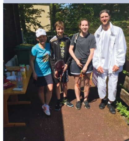
Animation « doubles surprise » où chacun vient avec sa bonne humeur partager un bon moment de tennis et d'amitié.

Dernière minute : reprise des championnats dès le 12 novembre. Bonne chance à nos équipes !